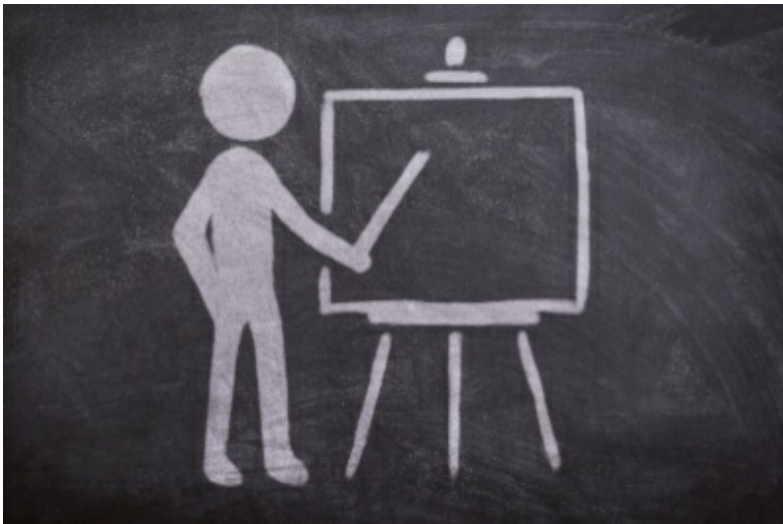
Prüfung und Beratung